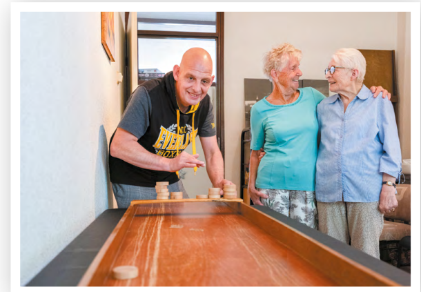
Elke woensdagochtend is het de zoete inval bij de Prettig Wonenlocatie aan de Zwaluwenlaan (oneven). Vandaag een potje sjoelen!

Via Waterweg Wonen kwam Remco terecht bij Prettig Wonen. "Dit is 1 van de 3 plekken waar bewoners gezellig kunnen samenkomen. Tegen de eenzaamheid, zeg maar. Ik weet nog dat ik de eerste keer hier binnenkwam. Iedereen riep: